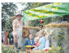
Festumzug zum Ende der Erntezeit