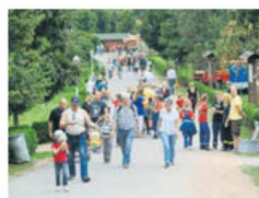
Trubel im Tierpark