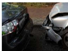
Auffahrunfall auf der Autobahn