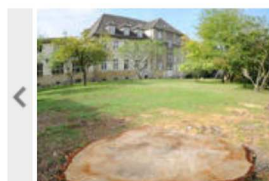
Knapp zehn Quadratmeter pro Polizist