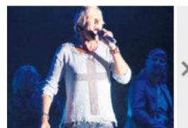
Matthias Reim im Regen